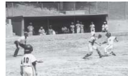
▲ホームを狙う海老名市選抜チーム

8月20日、益岡公園野球場で恒例となった姉妹都市神奈川県海老名市との少年野球大会が開催されました。今年の大会には、両市からそれぞれ2つの選抜チームが参加し、熱戦が繰り広げられました。