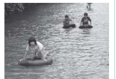
▲沢端川での川下り体験

子どもたちが良い社会人となって幸福な人生を送れるようにと始まったボーイスカウト運動の開始100周年を記念し、ボーイスカウト白石第一団が主催したものです。催しでは、魚のつかみ取りやいかだの川下り、野外料理体験などの多様なイベントが行われ、子どもたちは心ゆくまでスカウト活動を楽しんでいました。