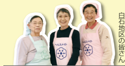
白石地区の皆さん

6月20日(土)の笹巻きの会で一緒に笹巻き作りましょう!(詳しくは22ページ掲載)