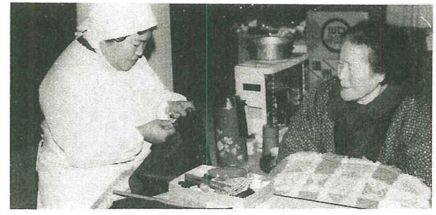
着物の出来あがりを楽しみに