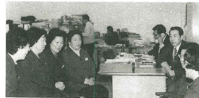
念入りに事務打合せ

二世帯平均に廻って世話をしていますが、最初は、他人から世話になるのはいやだと、受けつけてくれませんでした。今は、一週間一、二度来るのを待ちこがれ、日用品の買物から、身の上相談まで話題がつきません。