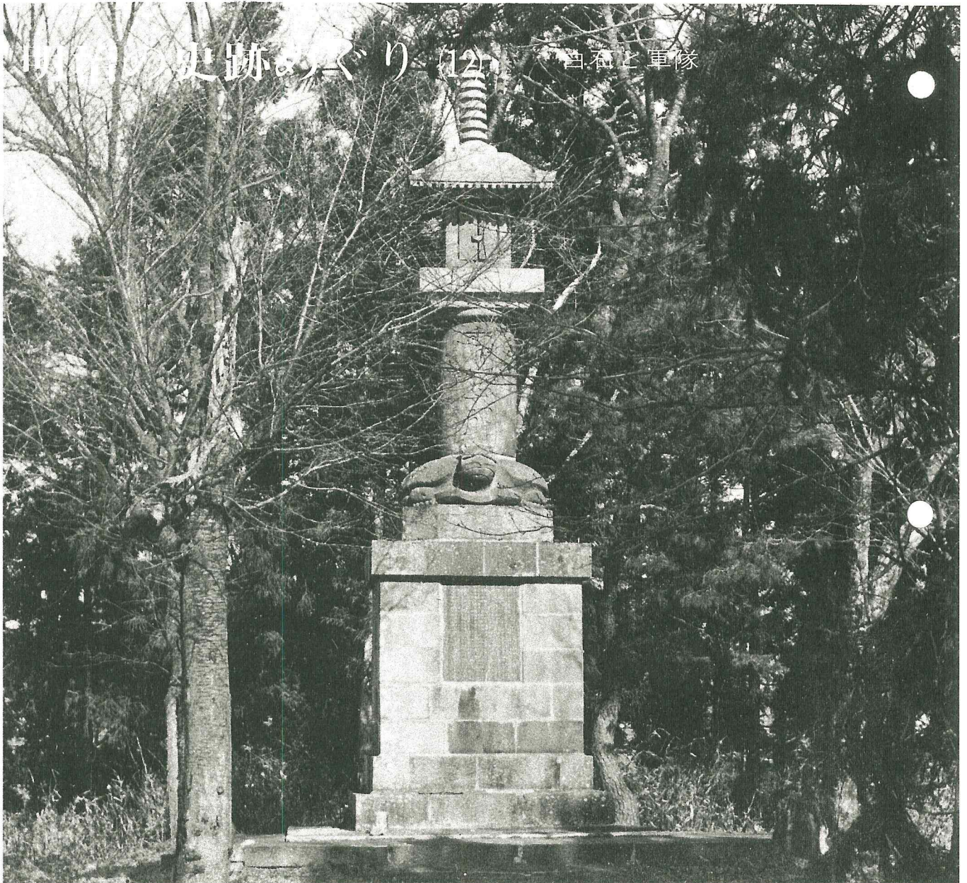
昭忠碑 (関連記事は5頁)

編集と発行 白石市役所総務課・宮城県白石市字桜小路35 昭和35年11月7日第三種郵便物認可 印刷 小泉印刷(株)