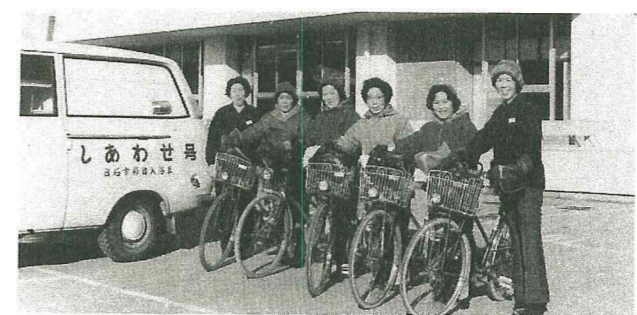
6名のヘルパーが市役所を出発