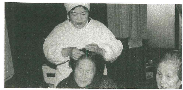
髪をとかしてもらい、晴ればれと