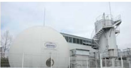
多数の団体が視察に訪れたシリウス (白石市生ごみ資源化事業所)