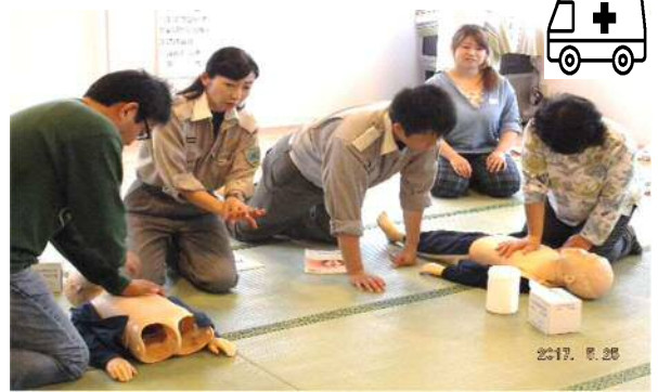
▲幼児の人形を使った実技講習の様子

5月25日、白石消防署の方を講師に迎え、「心肺蘇生法」、「AED の使用方法や救急救命法の実技講習」、「子どもに多い事故の事例と応急手当の方法」について講習を受けました。