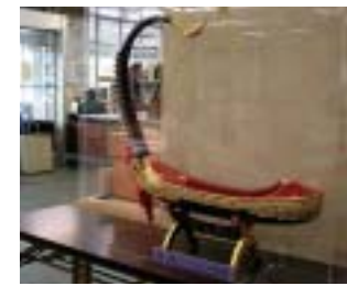
▲市庁舎1階に展示している「ビルマの竪琴」

「ガ島ミャンマー会(旧ガ島メダナ会)」は1997年に設立。太平洋戦争の激戦地だった南太平洋のガダルカナル島などに長年慰霊団を派遣してきた戦友会組織が、高齢化で派遣を打ち切った際に、有志が巡拝を続けようと設立されたものです。ミャンマーやガダルカナル島などへの慰霊巡拝以外にも、現地の住民との交流を深め世界平和に貢献しようと、日本政府の援助でガダルカ