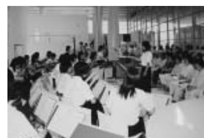
▲白石女子高マンドリン部の皆さんによるコンサート（昨年8月27日） Eメール：shomu@katta-hosp. shiroishi.miyagi.jp