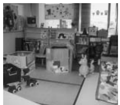
▲支援センター「あいあいルーム」