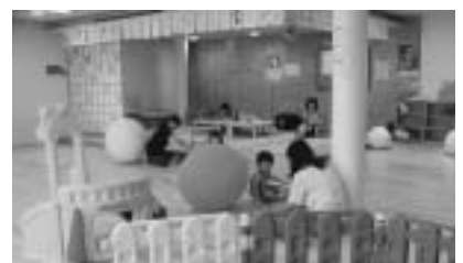
▲プレイルーム「やんちゃっこ」

場としてもご利用いただけます。※プレイルーム「やんちゃっこ」は、土・日・祝(10時から16時まで)も開館しています。ぜひご利用ください。