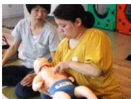
昨年の講習会の様子