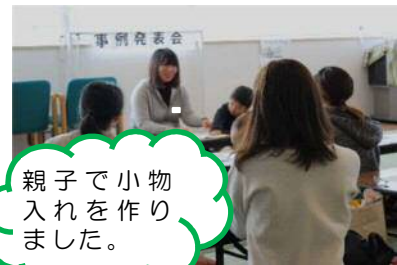
親子で小物入れを作りました。

昔と今で子育ての方法に違いはありますが、子どもを可愛いと思う気持ちは変わらないと思います。今後も安全にお子さんをお預かりしながら楽しい時間を過ごせるよう活動していきたいです。