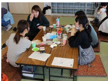
お菓子とお茶で懇談の様子

若いお母さん達の参加で活気のある交流会でした。お子様たちもかわいくてお茶会も楽しかったです。また参加したいです。よろしくお願い致します。