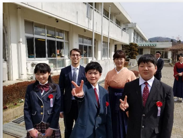
▲@齋川小学校卒業式

みなさん、こんにちは。残念ですが、今回の投稿が最後になります。僕にとって白石がどんな街なのかちょっと書きたいと思います。新しい経験をするために白石を離れることに決めました。白石で英語を教えることは素晴らしい機会でした。僕は生徒のみなさん、そして一緒に働いてきた先生のみなさんが大好きです。けれども自分の人生の次の節目に進まなければなりません。仲間の先生や生徒のみなさんのおかげでALTの仕事の中で僕は成長できたと思います。そして経験してきたことは素晴らしいものとなり、みなさんにはとても感謝しています。白石でALTとして勤めることができとても楽しく幸せでした。白石市は僕にとって特別な街になりました。白石に来る前は、それより2年先に日本に来ていて熊本に1年滞在しました。実は、熊本にいた時友達と東北について何も知らないと話していたのを覚えています。東北出身の人にも会いませんでした。ALTとして白石に行くことが分かって僕はワクワクしました。というのは熊本では驚くくらい素晴らしい経験をしていたので、もっと日本を知る必要があると分かっていたからです。後で白石に来ることがどれほどラッキーかが分かりました。白石はとても便利な街です。新幹線の駅と在来線の駅があります。病院もスーパーもたくさんありますし、でも一番大好きなところは自然と文化があることです。ひとつ例をあげれば、お城。白石城は本当にカッコイイし、そして、鬼小十郎まつりではいろいろなことが楽しめます！毎年このおまつりを近隣の街にいる友達に見せるのは凄い機会でした。また、熊本に住んでいたときは時々熊本城に行っていたので、白石城があると家にいるような感じになりました。白石うーめんも大好きですし、白石にあるたくさんのレストランに行って、美味しいものを食べて満喫しました。白石のことを思うととても寂しくなりますが、いちばんは白石のみなさんです。白石の人たちのことを思うと寂しくなります。白石で不親切な人には会いませんでした。みなさんおもてなししてくれ、「おもてなし」とはどういうことを教えてくださいました。このおもてなしは心を動かすもので、カナダに戻ったら僕の心に浮かんでくるものだろうなと思います。カナダに帰って何をするかまだはっきりしていませんが、仕事で日本に戻るかもしれないし、カナダで仕事を見つけるかもしれないです。いつか日本に絶対戻ってきます。とにかく、これからも白石、宮城、そして日本とつながり続けていきたいです。これまで最高の思い出の3年間を本当にありがとうございました。高校生の頃から日本に来て働くことが夢でした。それが実現し、そしてがっかりすることはありませんでした。それはみなさんのおかげです。この3年間の経験をいつも大事にしたいです。これからもみなさんと連絡を取り合っていきたいです。いつでもメールしてください。カナダに来るときは是非教えてください。カナダに友達がいるということを忘れないでください。いろいろありがとうございました。また会う日まで。 ビリー