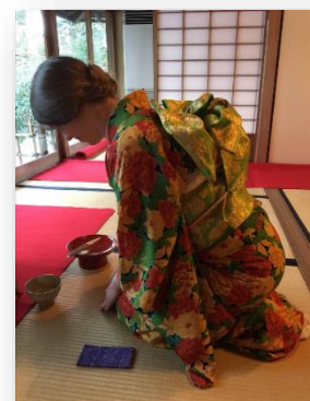
美しいキモノを着て・・・@碧水園でのお茶会▶