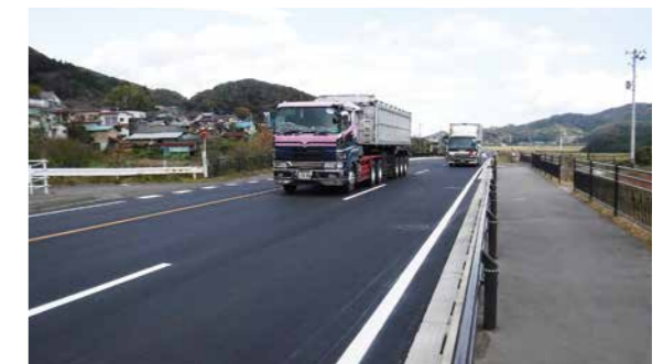
▲新たに供用開始された区間を走る車両