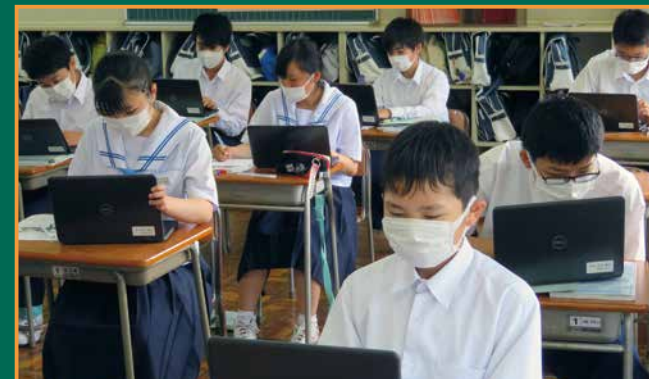
▲タブレットPCを用いて調べ学習を行う生徒

今後も学びのツールとしての活用方法を探りながら、生徒たちの学力向上に結び付けていきたいと考えています。