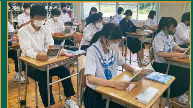
▲授業の中で暗唱する生徒たち