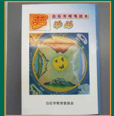
▲白石市暗唱読本「夢」