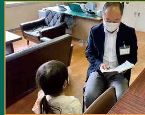
▲1年生の児童が、校長先生の前で、暗唱した話を発表しています

これからも、この暗唱読本を活用し、児童の健やかな成長に向けて取り組んでいきます。