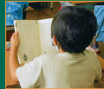
▲すらすら言えるように、頑張っている練習をしています