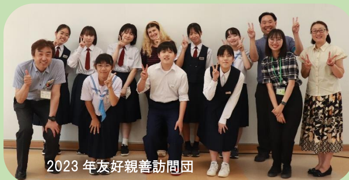
2023 年友好親善訪問団

英語の語学演習では、副団長のリードのもと、4 名の ALT (外国語指導助手)の協力を得ながら、実際のシーンを想定して練習しています。また、発表においては、事前研修中や研修外でも英語推進委員会の先生たちにもご協力いただいております。