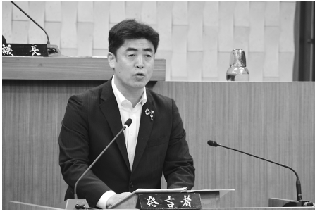
市長の提案理由説明

また最終日に、市長提出議案1件(第68号議案)が追加提案され、採決の結果、全会一致で原案のとおり可決しました。 同日、議員提出議案3件(議提第3号から議提第5号)が上程され、採決の結果、全会一致で原案のとおり可決しました。