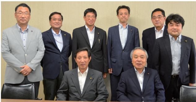
議会広報委員会委員