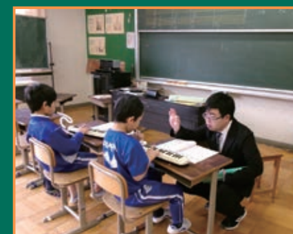
▲中学校教諭による授業(小2 音楽)