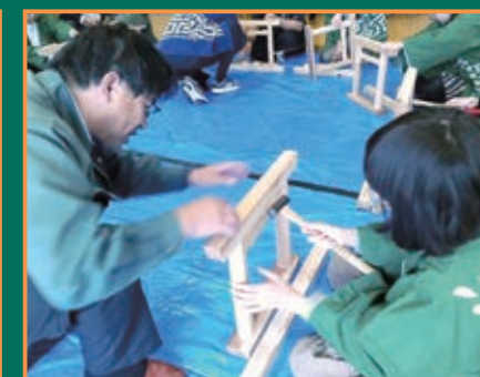
▲おしごと探検隊 in 白石