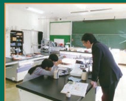
▲中学校教諭による授業(小5 理科)

また、本校の特色の一つとして、p4c(探究の対話)を取り入れた「対話的な学び」を朝活動や道徳の時間に行っています。児童生徒は、互いの考えを尊重し、対話を通じて深く思考し、多様な価値観に触れる貴重な学びの時間となっています。仲間との対話を通して、自分の考えを言葉にして伝えることや異なる意見も受け入れて自分の考えを深める姿勢、豊かな感性が育まれるとともに、互いを尊重した豊かな人間関係づくりも進んでいます。