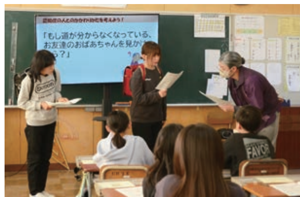
▲道が分からなくなった認知症の方に対する接し方の実演

11月27日、大鷹沢保育園で「白石産ササニシキ新米贈呈式」が行われました。これは地元の農産物を知ってもらおうと、「宮城白石産ササニシキ復活プロジェクト」が毎年実施しているもので、この日は新米2キロをプレゼント。園児たちは、新米で作ったおにぎりを試食し、「おいしい」と満足そうにほおばっていました。