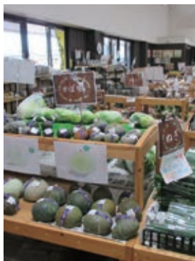
▲店内には、たくさんの新鮮野菜が並んでいます

おもしろいし市場は、地元産を中心とした新鮮農産物や農産加工品、物産品を豊富に取りそろえています。 また、併設する「カフェSUNSUN小十郎」では、市内産ササニシキや旬の野菜を使用するなど、地産地消に取り組んでいます。 おもしろいし市場では、農産物や農産加工品、物産品の出品会員を募集しています。詳細は問い合わせください。 ●営業日時 1月1～2日を除いて毎日9:00～18:00 おもしろいし市場 ☎26-9778