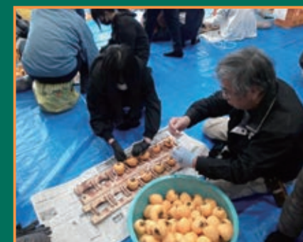
▲ころ柿づくり体験