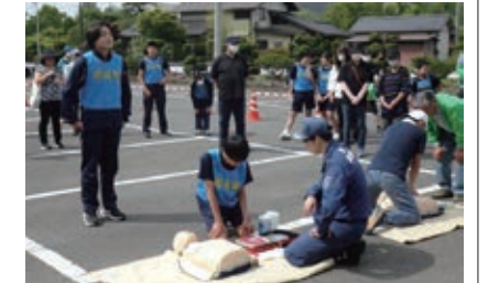
▲総合防災訓練の様子(自治会独自で実施したAEDによる心肺蘇生訓練)