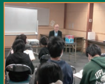
▲地域を学ぶお話し会

あるころ柿づくりに真剣に取り組みました。地域や保護者、大学の先生方などで組織された学校運営協議会の主催で開催した「おしごと探検隊 in 白石」では、5 つの事業所が校舎内に職業体験ブースを開き、子どもたちが楽しみながら職業や働く人の思いを学びました。地域の方と一緒に学ぶ体験は、子どもたちが社会と教科の学習とのつながりを実感でき、「もっと学びたい!」という意欲を持ち、将来の夢を育むきっかけになっています。