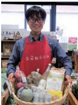
▲市内の「おいしい」が盛りだくさん！

地元の農産物や直売所などの魅力をお届けします。 ～白石市農産物直売所連絡協議会は、地産地消を推進！～