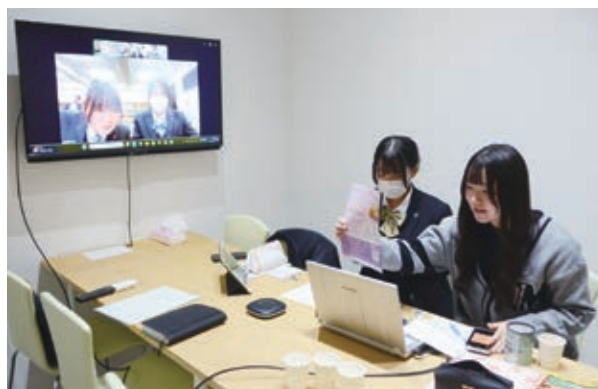
▲オンライン商談会で運営中の駅前カフェのチラシを紹介

12月4日、白石高校の生徒が運営するカフェ「Cafe Luna」で、新メニューをめぐるオンライン商談会が行われました。採用予定のハーブティーについて、開発元の聖光学院高校（福島県）と意見交換。試飲を通じ、県外校の地域振興の取組に触れる機会となりました。カフェは1月15・22・29日（全て木曜日）に営業します。