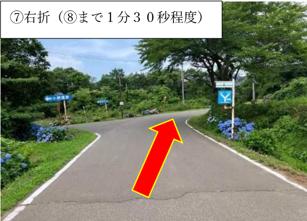
⑦右折 (⑧まで1分30秒程度)