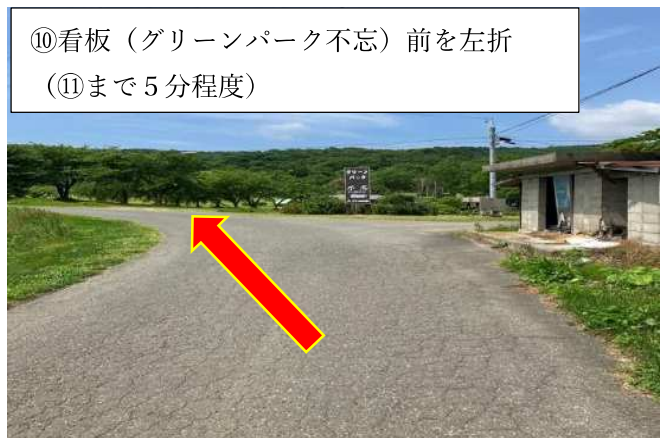
⑩看板 (グリーンパーク不忘) 前を左折 (⑪まで5分程度)