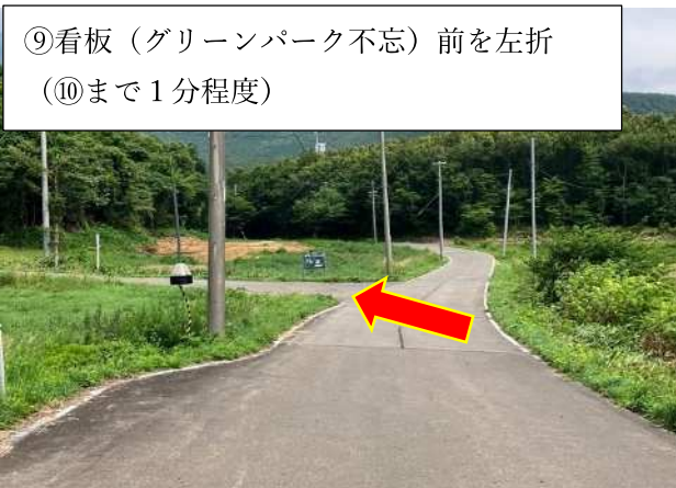
⑨看板 (グリーンパーク不忘) 前を左折 (⑩まで1分程度)