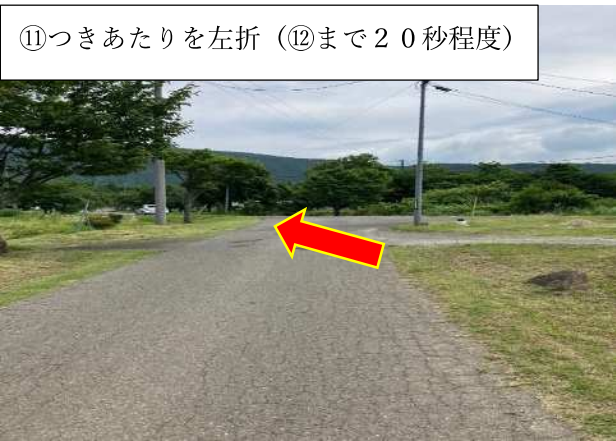
⑪つきあたりを左折 (⑫まで20秒程度)