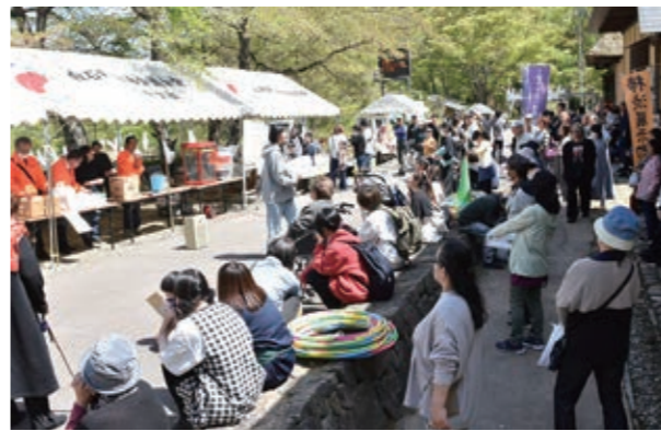
▲お楽しみ抽選会の抽選結果に固唾を飲む参加者たち

評一 一首目、呑む、食うは立派。カ仕事は残し、また後でなんてね。二 一首目、誰かに話すというより自身を鼓舞するうたなのである。三 一首目、お客さま第一、ママさんの熱心さが伝わってくる。もは強調の助詞。 評一 一首目、夜桜は日中の桜と異なり怪しい美しさがある。ライトアップされ、夜空に浮かぶ天守の白壁の、何と幽玄なことよ。二 一首目、抱いていた子が雲を指さして、あれは象さんあれは熊さんと言う。子供は花とも動物とも虫とも自由にお話しが出来る。三 一首目、亡き夫の墓参りも年老いてやっとなのである。砂利道に難儀していると手を引いてくれる人が！その優しさに胸が熱くなる。 評一 一首目、大国の衝突で原油の供給が止まり影響は計り知れない。アキレス腱のようなホルムズ海峡。一日も早い開通を祈るばかり。二 一首目、少子化の進行で、幼稚園から子どもの姿が消える事態に。教室から生徒が溢れるほどの時代もあった。昭和も遠くなりけり。三 一首目、気候がよくなり朝はつい寝過してしまっ。でも目覚まし時計は非情に鳴り響く。「春眠暁を覚えず」中国の偉人も同じ思いをしていたのかも知れない。