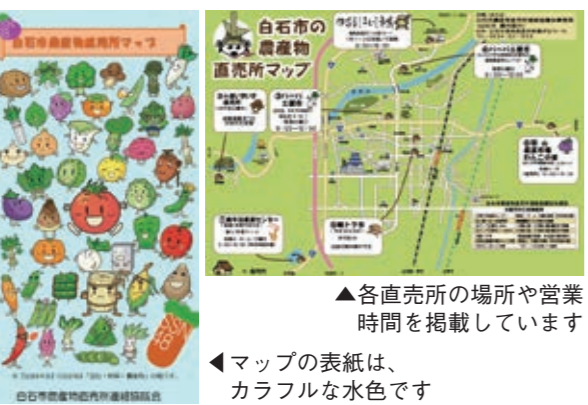
▲各直売所の場所や営業時間を掲載しています ▼マップの表紙は、カラフルな水色です

持ち運びに便利なポケットサイズ版を、市役所1階総合案内窓口や農林振興センター（農林課）、観光案内所、公民館に設置しています。各直売所では、旬の野菜やおススメ商品などを取りそろえています。マップを片手に、ぜひ直売所を巡ってみてはいかがでしょうか。 ※白石市農産物直売所連絡協議会に加盟する直売所の情報を掲載しています。農産物直売所マップに掲載していない情報は、各直売所までお問い合わせください。 ☎農林課 ☎22-1253