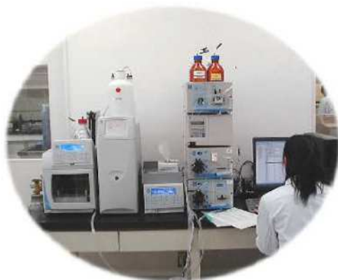
陰イオン(フッ素、塩素等) を一斉に分析する機器