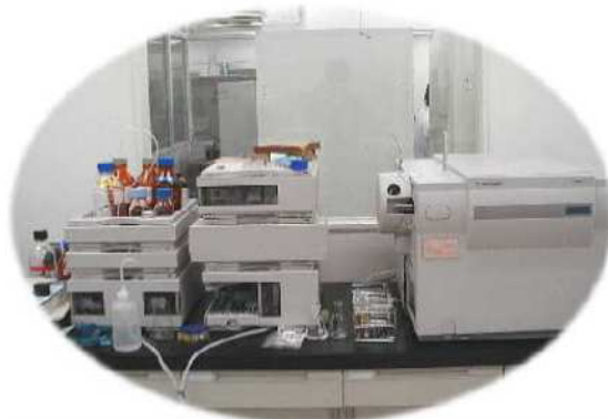
農薬類を分析する機器