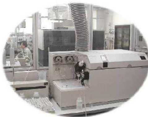
重金属類(鉛・カドミウム等) を分析する機器