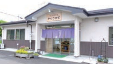
◀地域名から名付けられた「わんこの家」

「わんこの家」は、白川地区の国道113号沿いに位置し、市内外からのお客さんでにぎわっています。直売所では地元の新鮮野菜のほか、本市ではここでしか買えないちみつや卵を販売しています。ぜひお越しください！