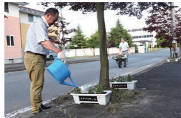
▲従業員が植えた花々が工場前の道路を彩りました

5月24日、中央公民館で「第49回白石市こどもまつり」が行われました。市内の子どもたちが多数参加し、ペットボトルボウリングなどの体験コーナー、丸太切りした木でネックレスを作る工作コーナーなどを楽しみました。会場には笑顔と元気な声があふれ、子どもたちは思い思いにイベントを満喫していました。