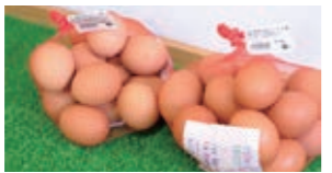
新鮮な卵はおすすめ！▶