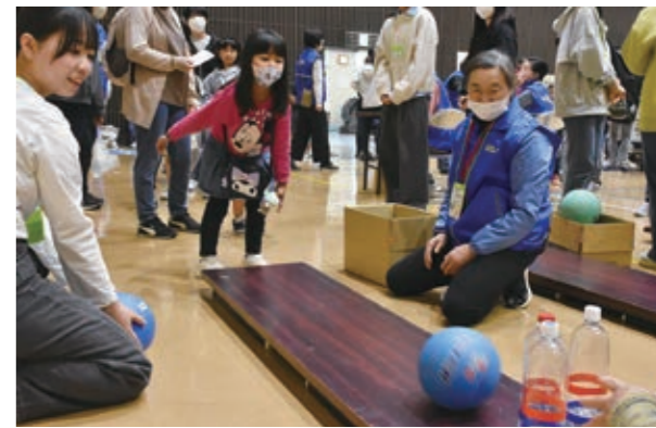
▲ペットボトルボウリング何本倒せるかな？

6月3日、南保育園をはじめとする市内公立保育園・幼稚園3園で水道点検が行われました。この活動は、6月1日から7日までの「水道週間」に合わせて市内の水道業者で構成される白石市管工事業協同組合が実施。園児は「水を守るヒーローみたいでかっこいい。これからも水を大切にしていきたい」と話していました。