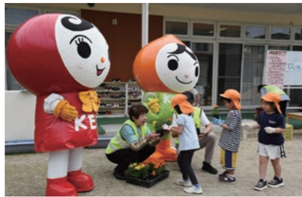
▲人権キャラクターと人権擁護委員から花苗を受け取る園児たち

【一】首目、特殊詐欺はあの手この手でやって来る。「あなたに逮捕状が出ている」などと言って動揺につけ込む手口もあるとか。 【二】首目、冬眠からさめて市街地にまで出沒するクマ。被害も増えている。戸を開けて入って来るその知恵に驚きと戦慄が走る。 【三】首目、大鷹沢若林藤の回廊は見事で白石の名所のひとつ。「下がるほど人が見上げる藤の花」近くにグラウンドゴルフ場もある。