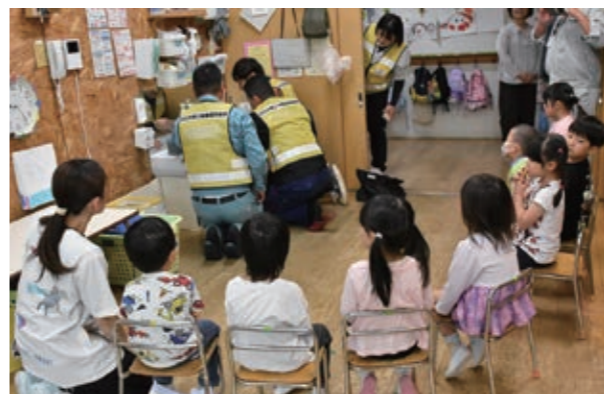
▲点検作業を真剣なまなざしで見つめる園児たち

5月26日、白石はるかぜ保育園で人権擁護委員による人権教室と「人権の花運動」が行われました。この活動は、花を植えて育てることを通して、生命の大切さを学び、優しさや思いやりの心を育むことを目的に、市内の保育施設などで実施。当日は人権キャラクターも一緒に参加し、園児たちは楽しみながら花苗を植え付けました。