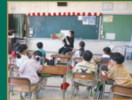
▲1年生への読み聞かせ

流を深めました。児童は思いやりの心を育むとともに自分たちの成長を実感しています。今年の4月には、1年生の出身園である北保育園と白石みのりこども園の先生が本校で読み聞かせを行ったり、1年生と一緒にp4cを行ったりしました。入学後に小学校の生活へスムーズに移行し、安心して学習などに取り組めるよう連携を進めています。今後も保育園・こども園との連携を大切に、幼保小の円滑な接続に努めていきます。