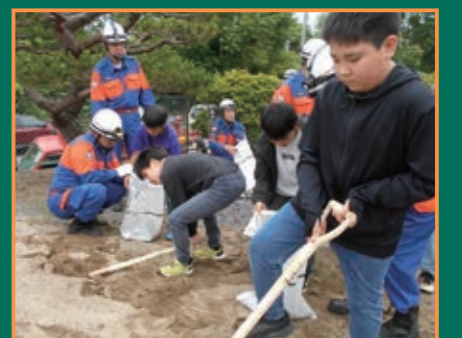
▲越河公民館での体験訓練