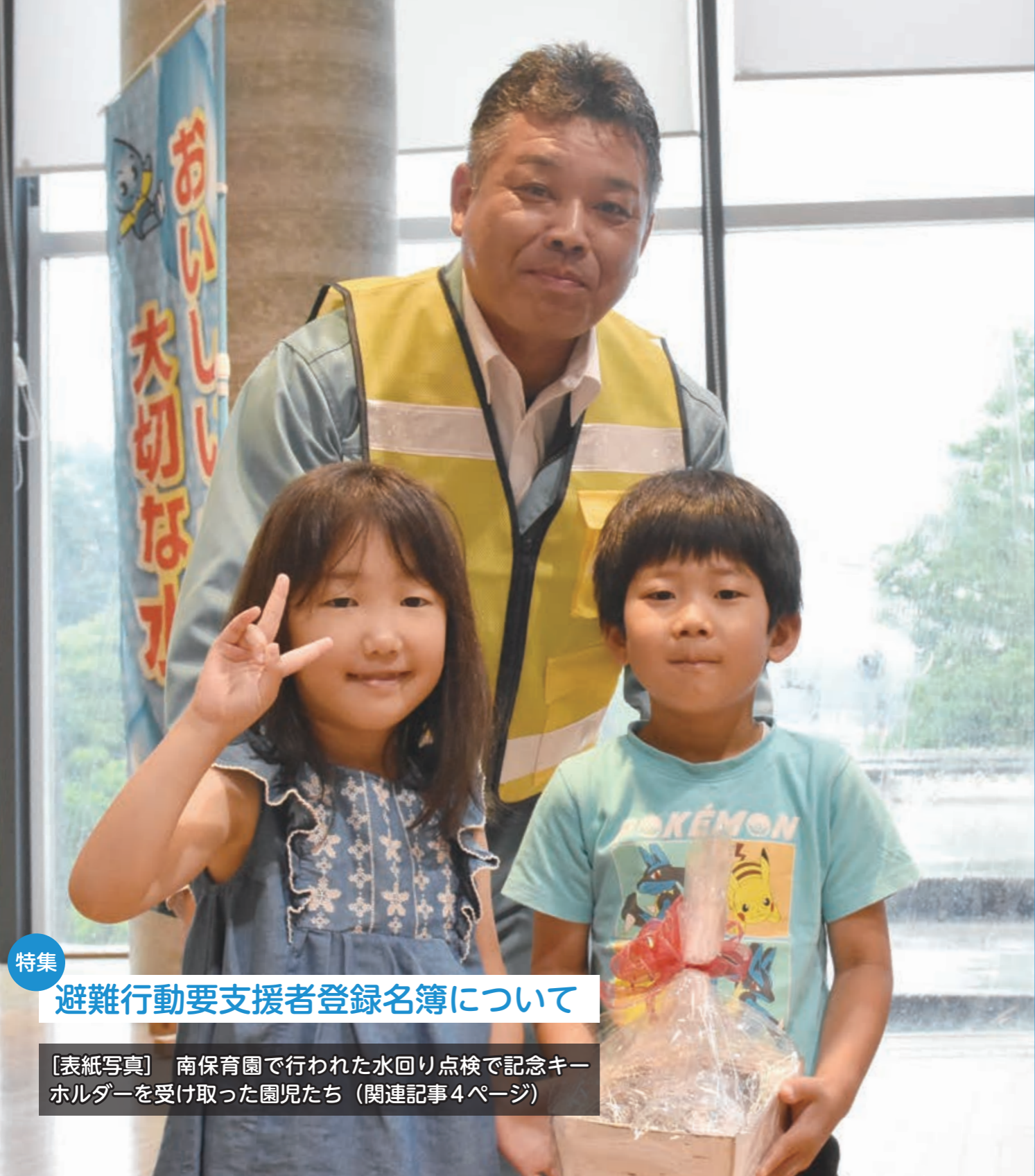
特集 避難行動要支援者登録名簿について [表紙写真] 南保育園で行われた水回り点検で記念キーホルダーを受け取った園児たち (関連記事4ページ)