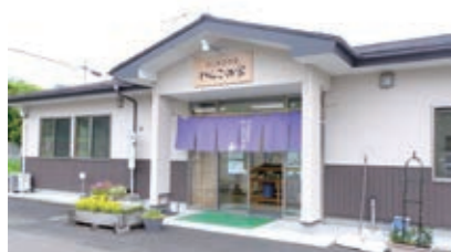
◀地域名から名付けられた「わんこの家」