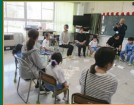
▲入学したばかりの1年生と保育園・こども園の先生と一緒にp4c