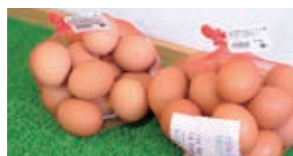
新鮮な卵はおすすめ！▶