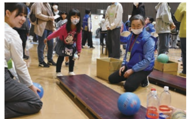
▲ペットボトルボウリング何本倒せるかな？

6月3日、南保育園をはじめとする市内公立保育園・幼稚園3園で水道点検が行われました。この活動は、6月1日から7日までの「水道週間」に合わせて市内の水道業者で構成される白石市管工事業協同組合が実施。園児は「水を守るヒーローみたいでかっこいい。これからも水を大切にしていきたい」と話していました。