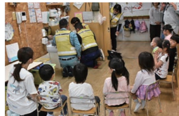
▲点検作業を真剣なまなざしで見つめる園児たち

5月26日、白石はるかぜ保育園で人権擁護委員による人権教室と「人権の花運動」が行われました。この活動は、花を植えて育てることを通して、生命の大切さを学び、優しさや思いやりの心を育むことを目的に、市内の保育施設などで実施。当日は人権キャラクターも一緒に参加し、園児たちは楽しみながら花苗を植え付けました。