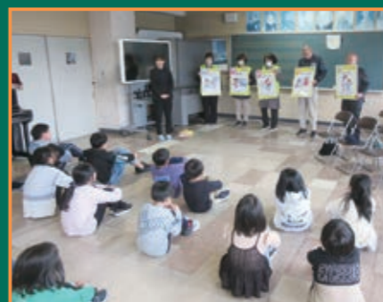
▲白石警察署と連携した防犯教室