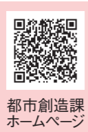
都市創造課ホームページ