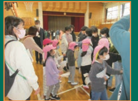
▲「ふれあい祭り」に北保育園の園児が参加