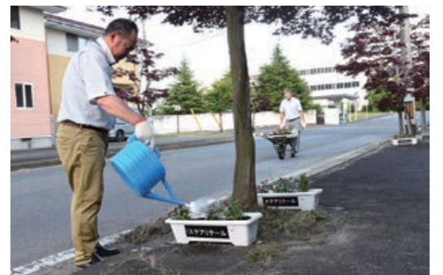
▲従業員が植えた花々が工場前の道路を彩りました

5月24日、中央公民館で「第49回白石市こどもまつり」が行われました。市内の子どもたちが多数参加し、ペットボトルボウリングなどの体験コーナー、丸太切りした木でネックレスを作る工作コーナーなどを楽しみました。会場には笑顔と元気な声があふれ、子どもたちは思い思いにイベントを満喫していました。