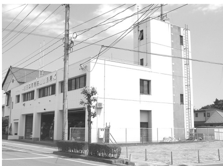
消防署と取得用地

〔答弁〕仙南2市7町では仙南地域広域行政事務組合に対し、消防署用地等を貸し出す場合、無償で貸し付けているため、今回の場合も無償で貸し付けとなる。