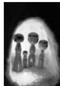
昨年のコンクール特選作品

第44回全日本こけしコンクール(5月3日～5日・ホワイトキューブ)の併設イベントとして開催する、「こけし」を題材とした写真コンクールに応募してみませんか。(こけしに関するものであれば何でも可) 応募資格 アマチュアの方 サイズ 四切り(ワイド四切り可)のカラー・白黒写真。(継ぎ写真やスライド不可) 応募規定 作品は未発表のものに限ります。応募点数は1人2点