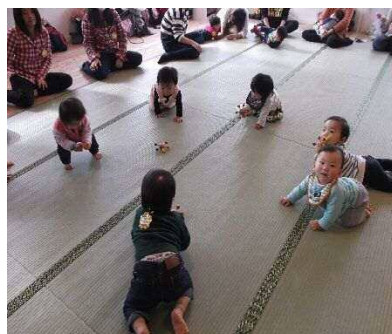
↑ハイハイる一む 上手にハイハイ