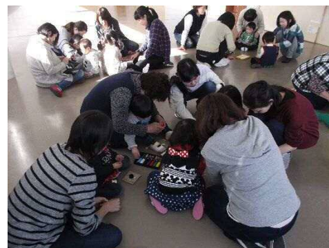
←手作りコマを作ろう