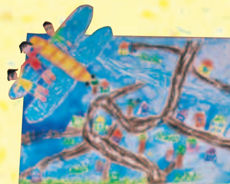
「トンボに乗って空をとびたいな」