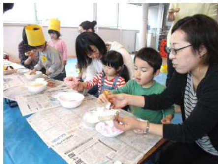
第1回絵画造形教室「ドーナッツを作ろう」