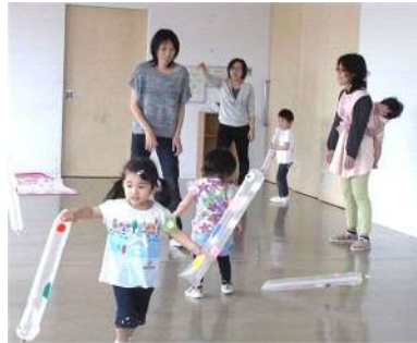
こいのぼりを作って遊ぼう。サンサンるーむ